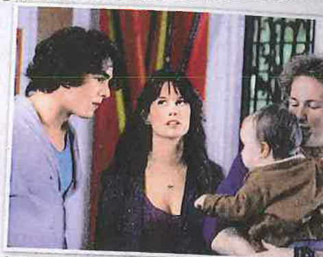
La vie amoureuse de Clem n'est pas de tout repos.

Mes enfants sont partis de la maison, alors j'ai retrouvé la liberté de mon adolescence ! [Rires.] J'ai pu m'adonner à ma passion pour le chant. J'ai aussi peint un tableau, Infine Tristeza* , pour aider l'association Orphan-Aid Africa (OA), que je soutiens depuis dix ans. Je vis une cinquantaine glorieuse et j'ai envie de profiter de la vie ! Aujourd'hui, on