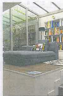
L'espace bibliothèque ambiance tropicale.