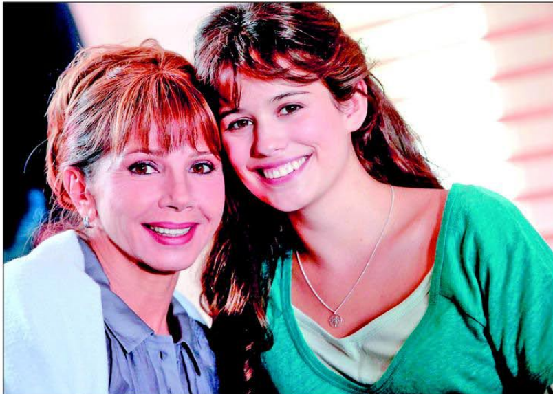
CHARME IBÉRIQUE. À 52 ans, la comédienne Victoria Abril (à gauche) n'a rien perdu de son charme ibérique, ni de sa franchise.

Mais c'est une famille normale qui cherche simplement des solutions positives à des problèmes de la vie courante. Ce n'est pas une famille d'extraterrestres malgré la problématique centrale d'une ado qui a un enfant à 16 ans. Ça ne court pas les rues, mais ça existe. Quand on m'a proposé le premier Clem , j'ai trouvé ça tellement bien et juste que j'ai refusé un film au cinéma pour le faire.