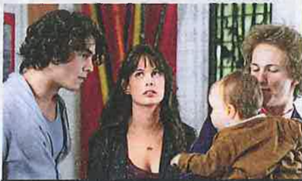
Toujours pleine de charme, Clem (Lucie Lucas).

Vous avez déclaré avoir toujours joué des rôles qui n'étaient pas écrits pour vous. Celui de Caroline vous colle pourtant à la peau... Maintenant oui, parce que les scénaristes me connaissent pas cœur. Ils m'offrent du sur-mesure, comme cette scène où je chante a cappella